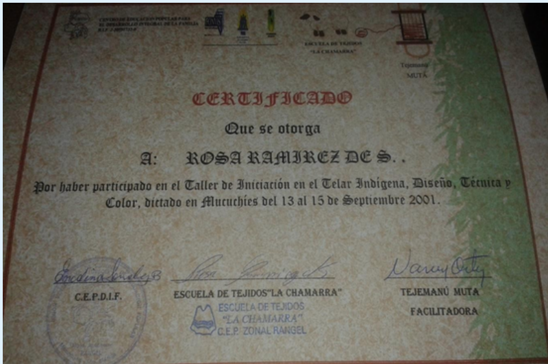
Imagen 9 Certificados.