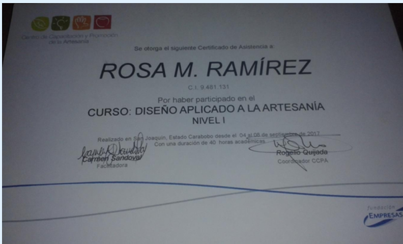
Imagen 11 Certificados.