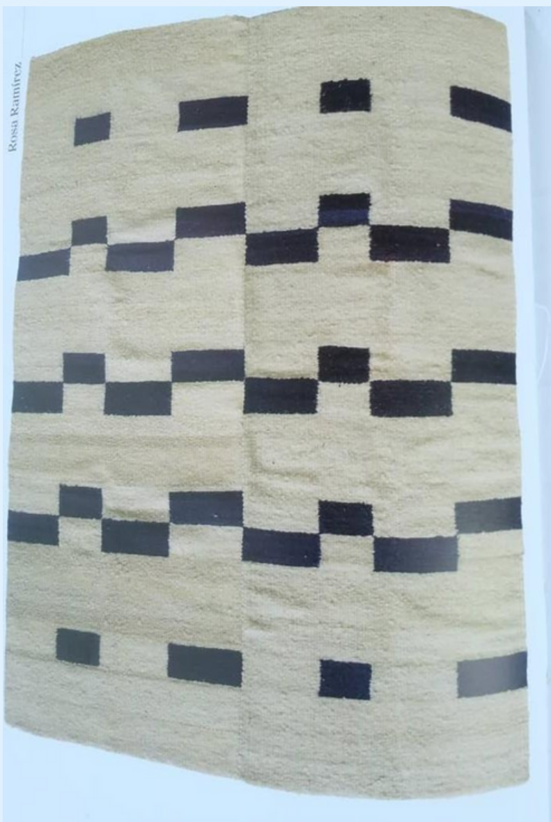
Imagen 12 Tejido elaborado por las Sra. Rosa.