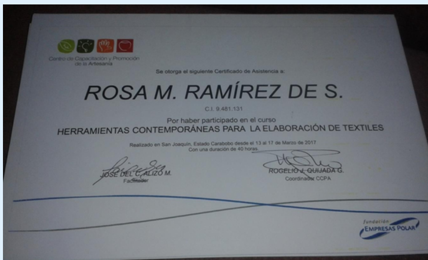
Imagen 10 Certificados.