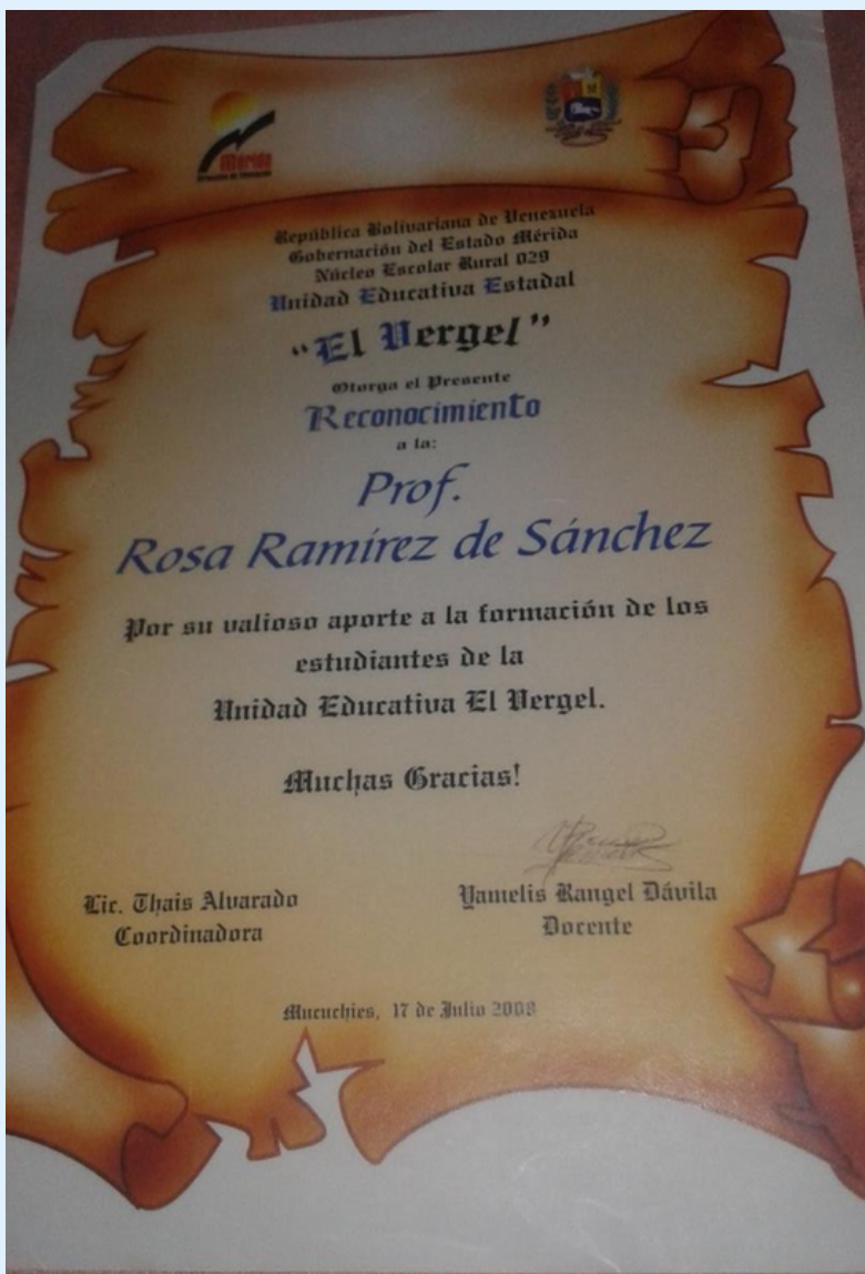
Imagen 6 Certificados.