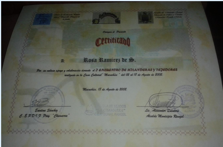
Imagen 8 Certificados.