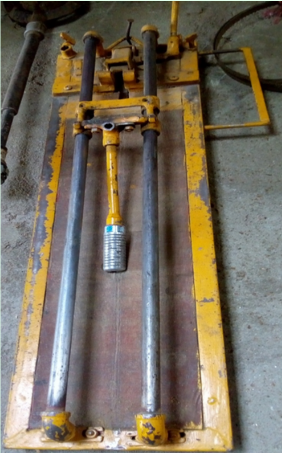
Maquina cortadora de cerámica.