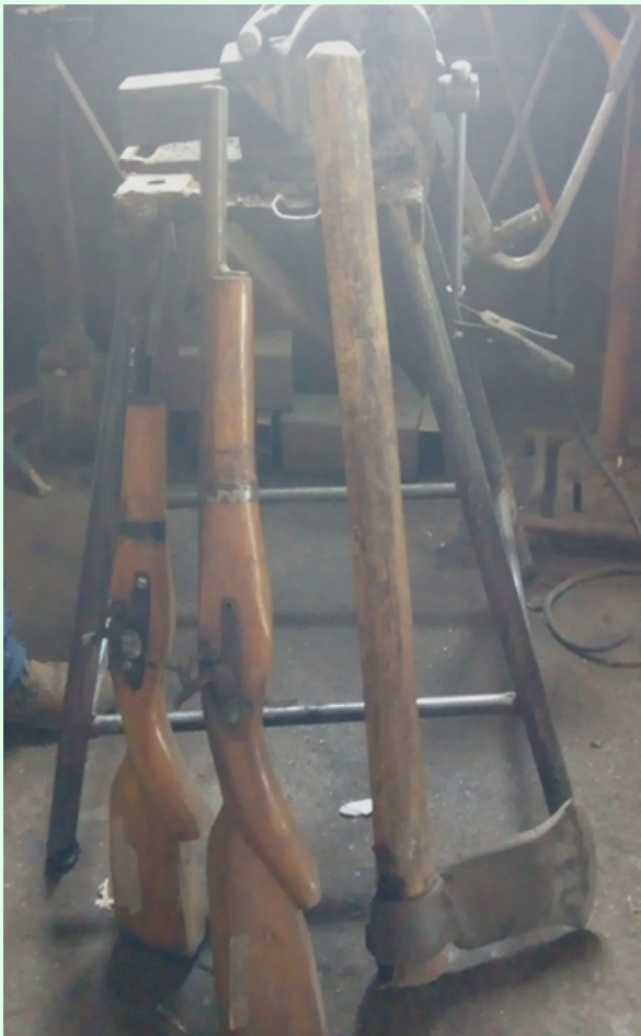
Trabuco para los negros de San Benito y hacha.