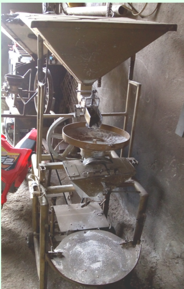
Molino para preparar la harina de trigo criolla.