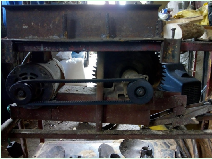
Parte del taller.