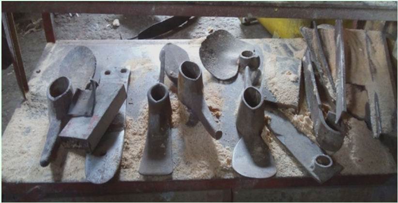
Picos y palas.