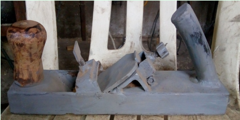
Cepillo para pulir madera.