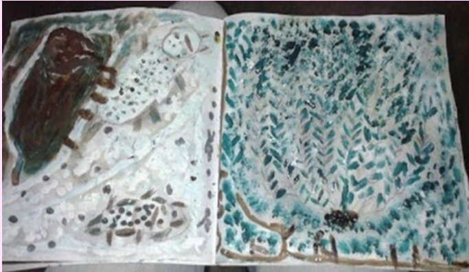
Imagen 12 Utilizó óleo y chimó.