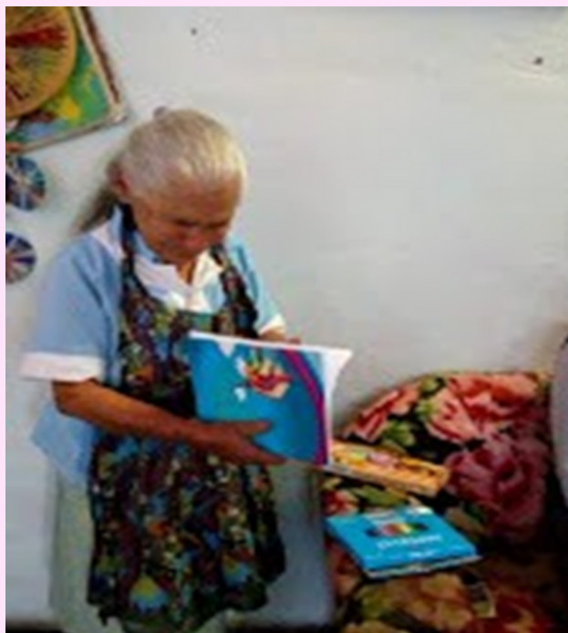
Imagen 20 Revisando cuaderno de dibujos.