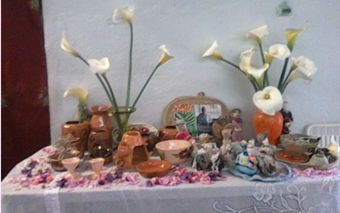
Imagen 29 Producciones en arcilla.