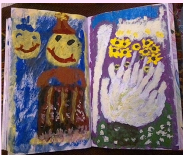
Imagen 9 Utilizó pintura al frío y óleo.