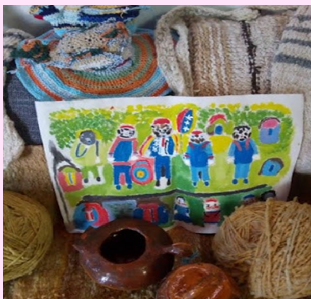
Imagen 19 Utilizó óleo sobre lienzo, ollitas de arcilla, tejidos en lana y lanilla.