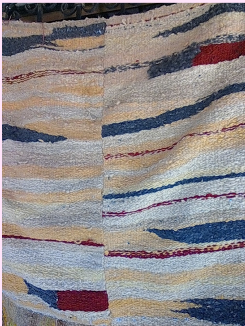
Imagen 24 Tapiz tejido en telar horizontal con lana de oveja preparada por ella, pintada con plantas.