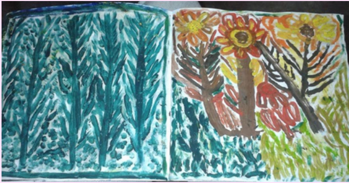
Imagen 11 Utilizó óleo.