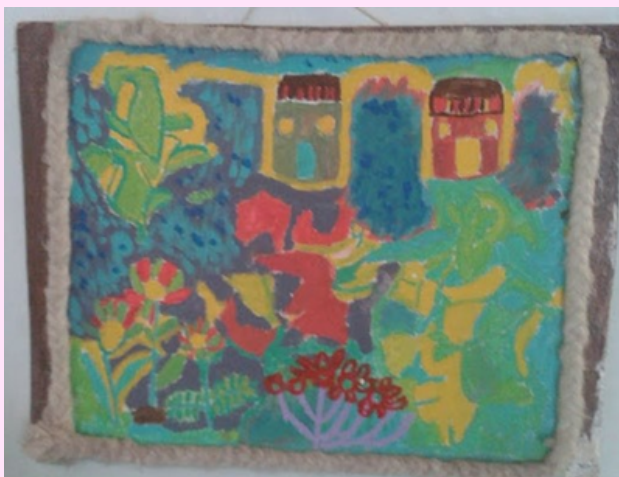
Imagen 16 Utilizó óleo sobre lienzo.