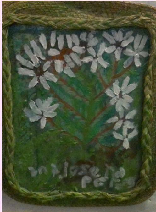
Imagen 8 Utilizó pintura al frío, óleo, lo colocó sobre una base de vetiver con un marco de trenza de vetiver.