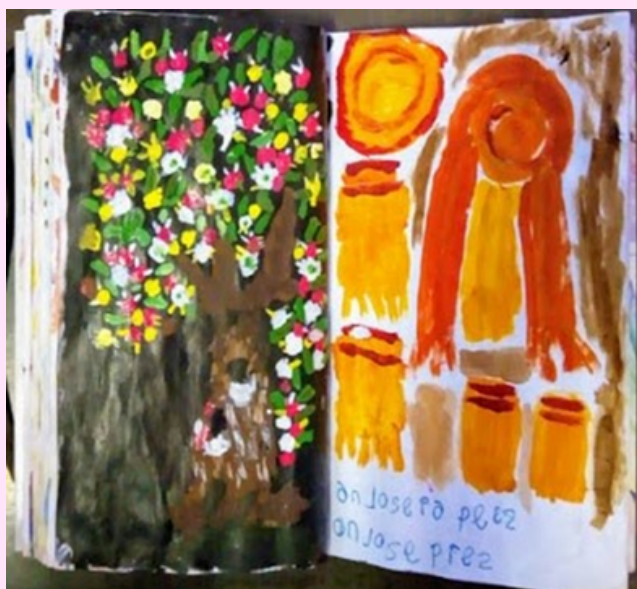
Imagen 10 Utilizó pintura al frío y óleo.