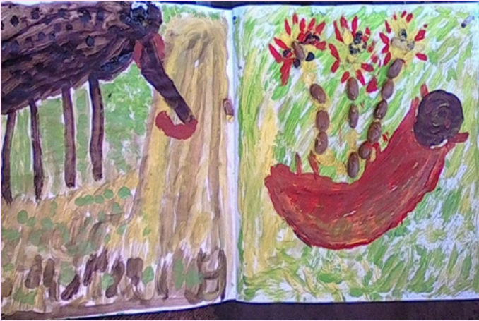
Imagen 7 Utilizo chimo, óleo y le agregé granitos de caraotas rojas.