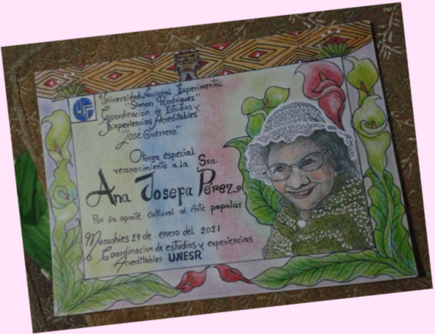
Imagen 37 certificado de Chepita.