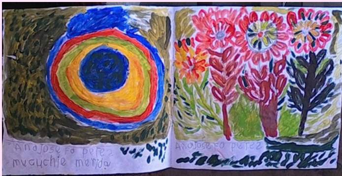
Imagen 6 Utilizo chimo y óleo. Abajo su firma.

Las siguientes imágenes las realizo en cuadernos de dibujo y con distintos tipos de pintura como: al frío, acuarela, óleo, colores y chimo.