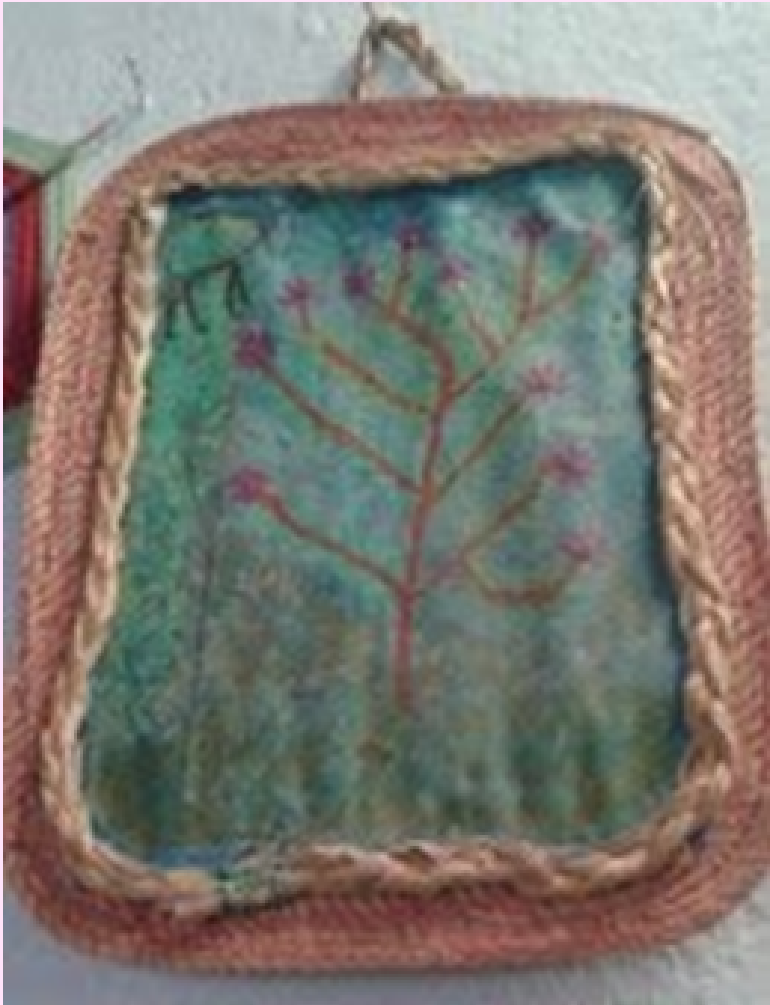
Imagen 17 Utilizó óleo sobre lienzo. Colocó sobre una base de vetiver y un marco tejido.