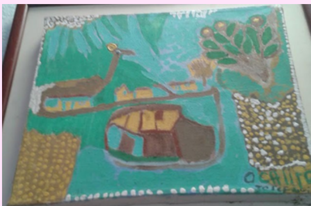
Imagen 15 Utilizó óleo sobre lienzo.