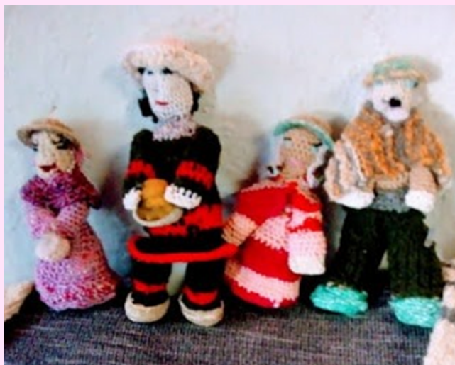
Imagen 26 Muñecas tejidas en croché.