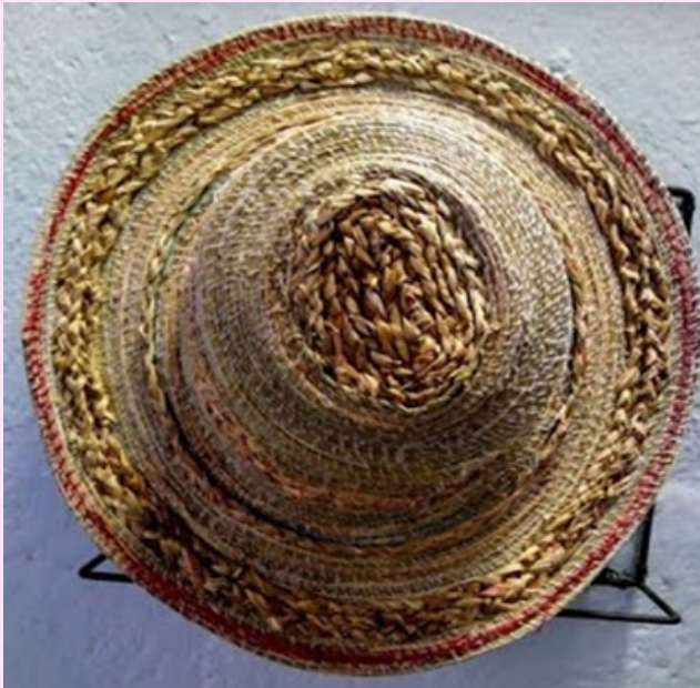
Imagen 31 Sombrero tejido con una especie de paja que se produce naturalmente en esta zona del páramo.