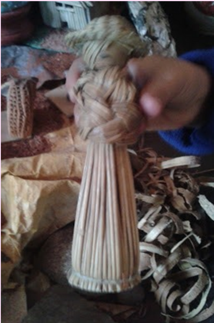
Imagen 30 Muñeca decorativa en concha de cambur.