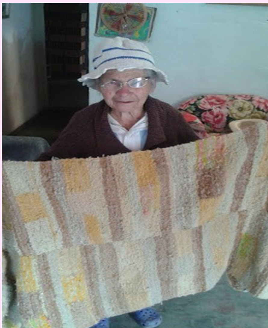
Imagen 22 Tapiz en lana de oveja preparada por ella y teñida con plantas.