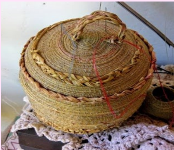
Imagen 32 Cesta tejida con el mismo material de la imagen anterior.