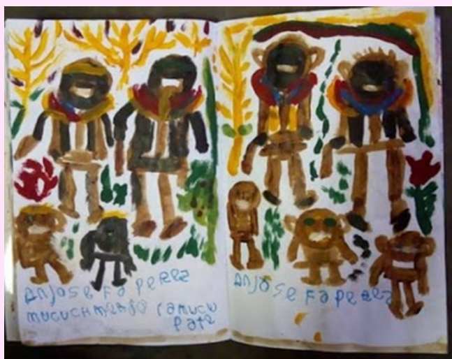
Imagen 13 Utilizó chimó y pintura al frio.