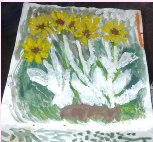
Imagen 18 Utilizó óleo.