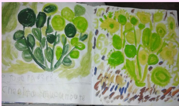
Imagen 14 Utilizó óleo.